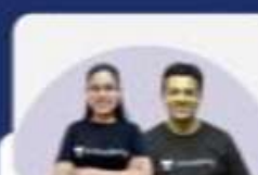
RAPID REVISION BATCH FOR RJS & HJS