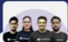
JUDICIARY MAINS LINKING BATCH

Top Educators of Unacademy have curated detailed Batch Courses to provide you with everything you need to crack Judiciary PCS (J).