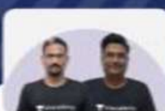
EXPERT BATCH FOR JUDICIARY