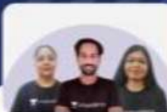
YODHA - 18 MONTHS FOUNDATION BATCH FOR JUDICIARY