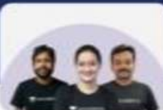
EMERGE | 1 YEAR BATCH