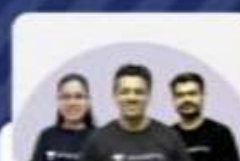
JUDICIARY LINKING BATCH