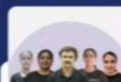
COMPREHENSIVE JUDICIARY BATCH