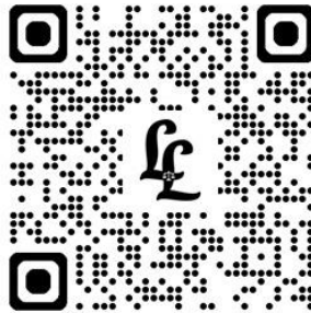
National Green Tribunal Act, 2010