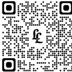
Air (Prevention and Control of Pollution) Act, 1981