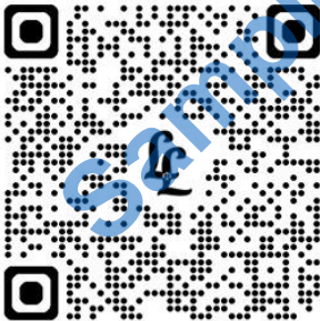
Environment Protection Act, 1986