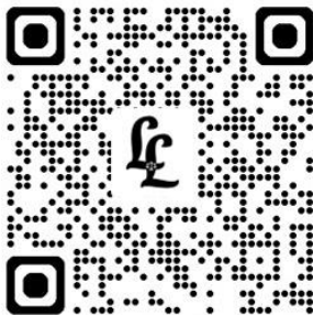
Water (Prevention and Control of Pollution) Act, 1974