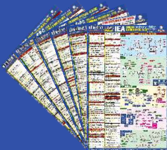
Major Laws Linking Chart