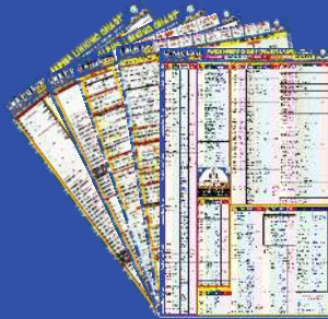
Alpha Minor Amendment Linking Chart