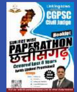
CG PCS (CJ)