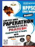
HP SC (CJ)