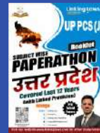
UP PCS (J)