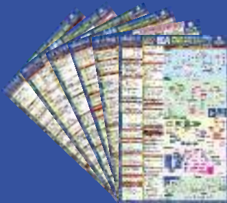
Major Laws Linking Chart