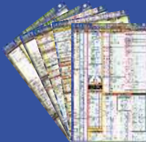
Alpha Minor Amendment Linking Chart