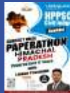
HP PSC (CJ)