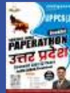
UP PCS (J)