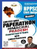
HP SC (CJ)