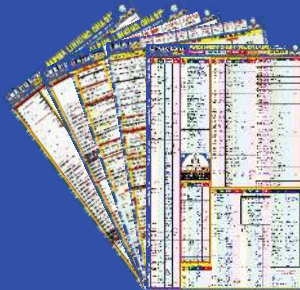
Alpha Minor Amendment Linking Chart