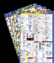
Minor Laws & Alpha Linking Charts