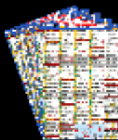
Major Laws Linking Charts