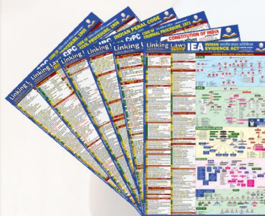
Major Laws Linking Chart