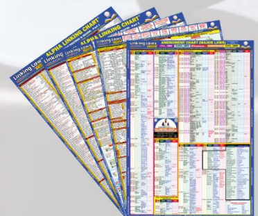
Alpha Minor Amendment Linking Chart