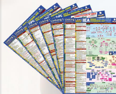
Major Laws Linking Chart