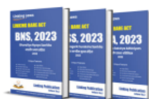
Criminal Major Laws Linking Bare Acts